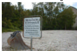
Ausführungstermine der Maßnahmen zu informieren.