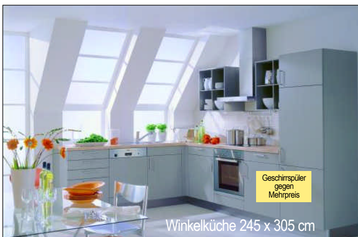
Winkelküche 245 x 305 cm

Wir können keine Verantwortung für evtl. Tippfehler oder die Richtigkeit der veröffentlichten Angaben übernehmen